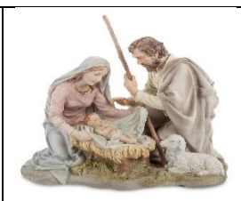
Б) Рождество Христово